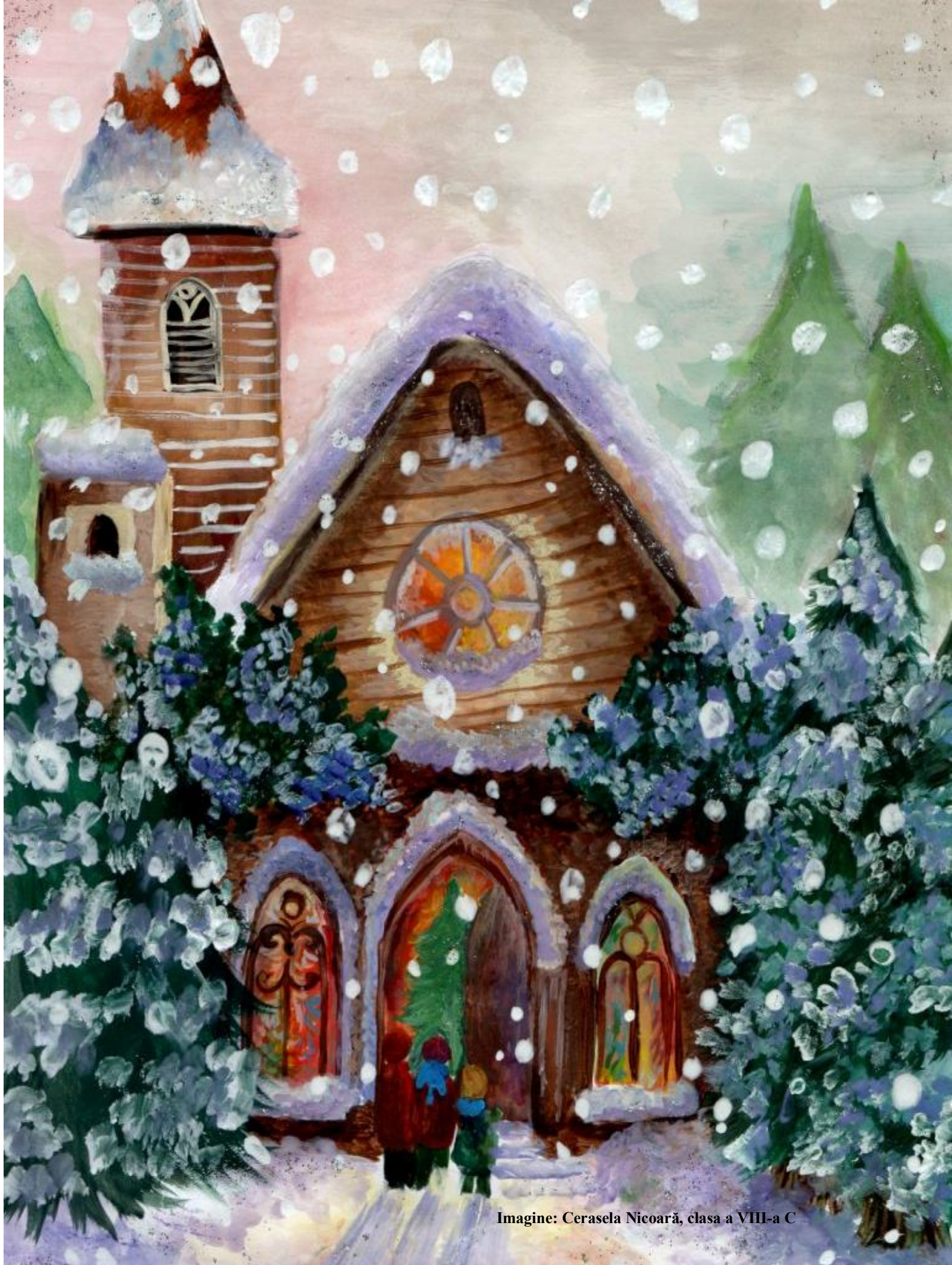
Imagine: Cerasela Nicoară, clasa a VIII-a C