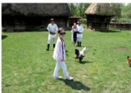
Eu și vietățile muzeului