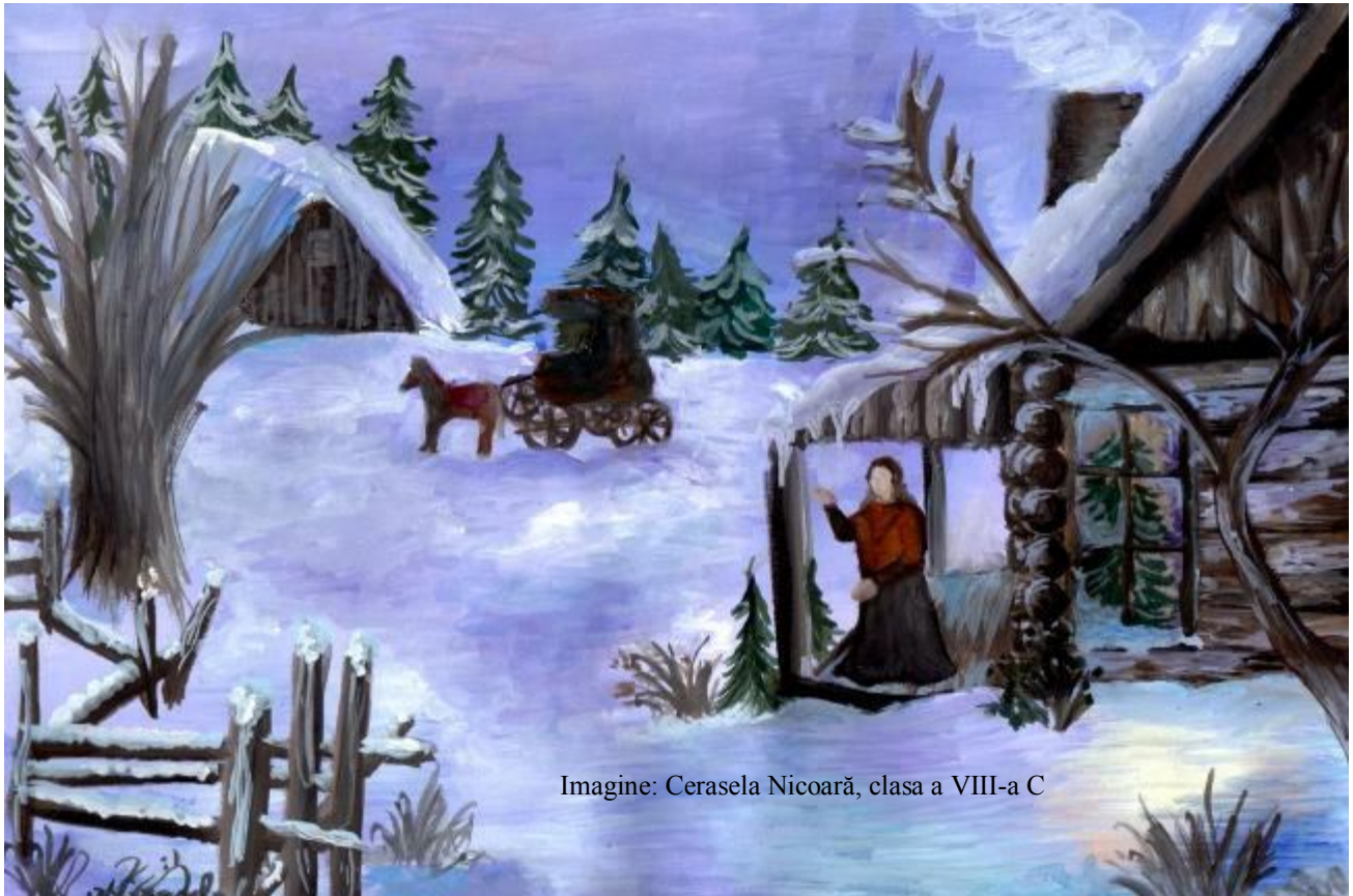
Imagine: Cerasela Nicoară, clasa a VIII-a C