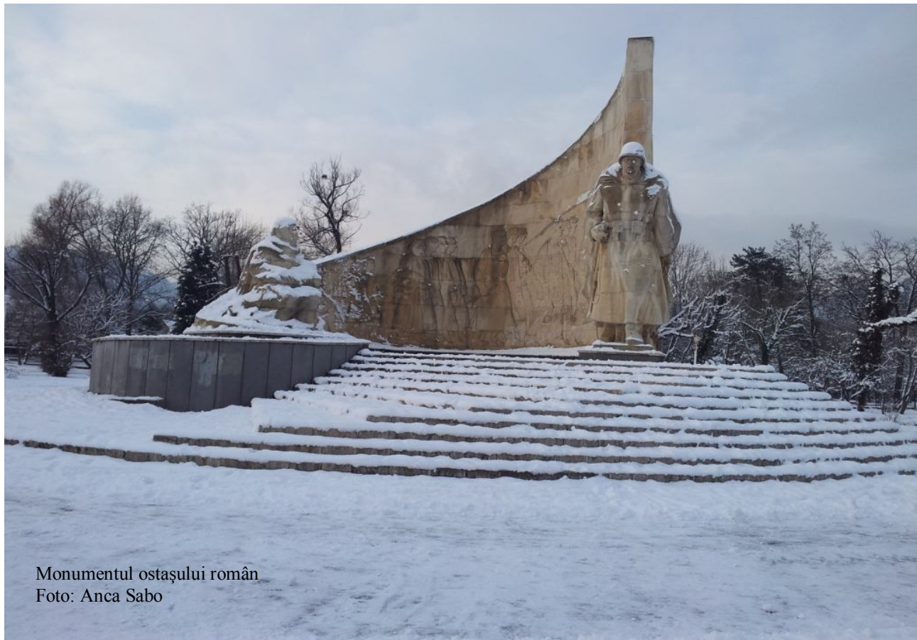
Monumentul ostaşului român