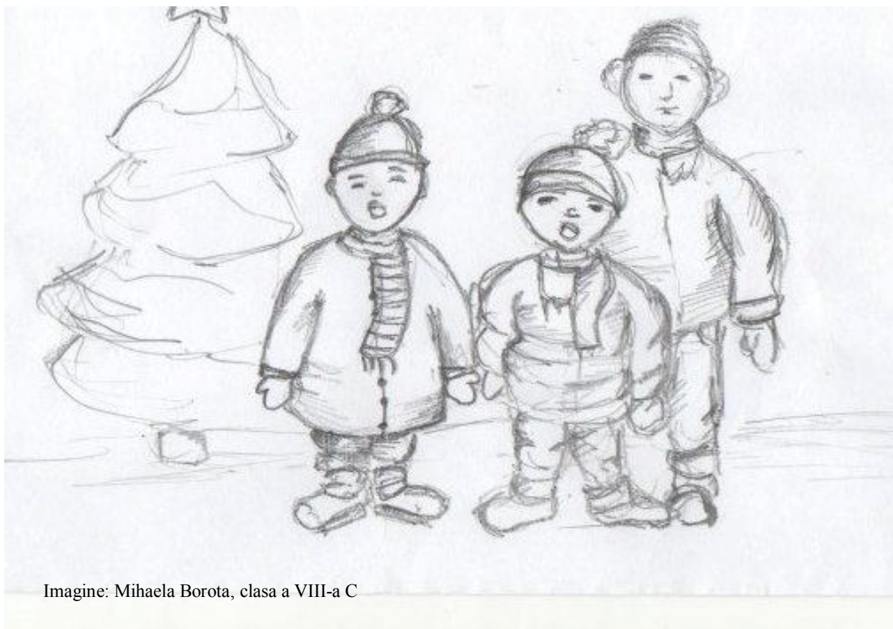
Imagine: Mihaela Borota, clasa a VIII-a C