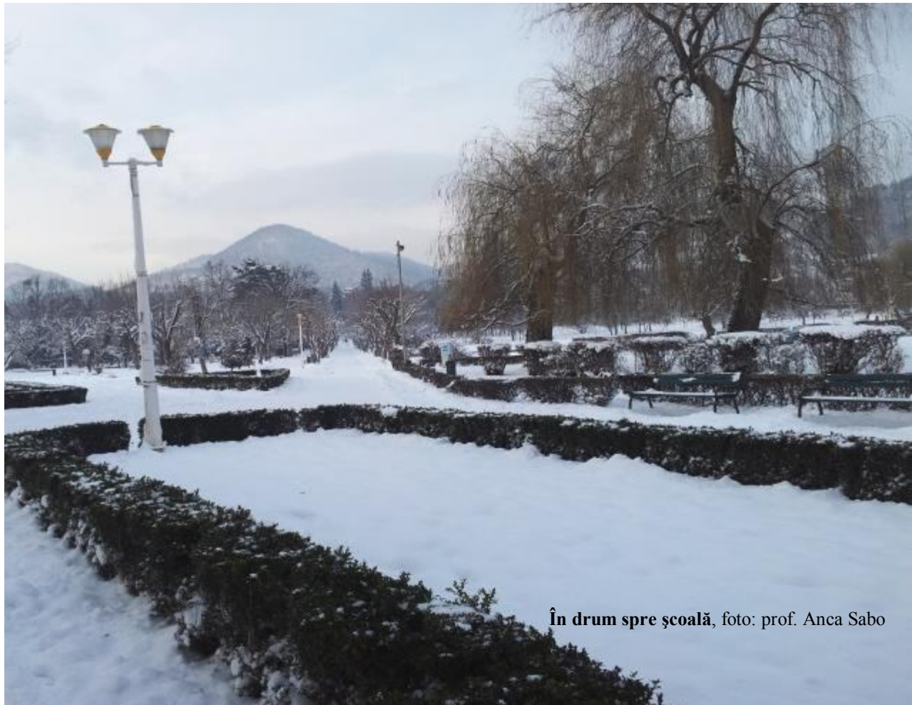
În drum spre școală