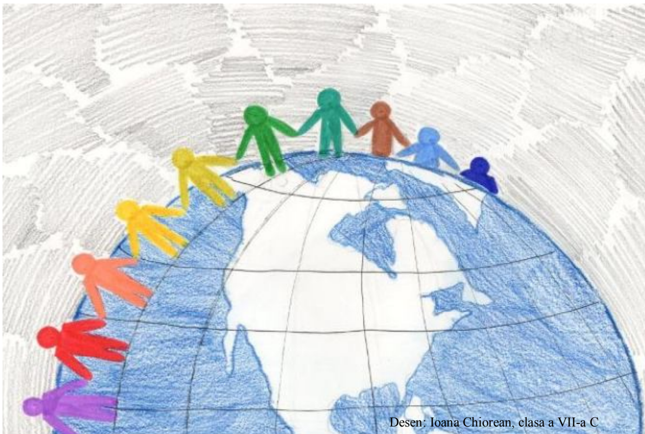
Desen: Ioana Chiorean, clasa a VII-a C