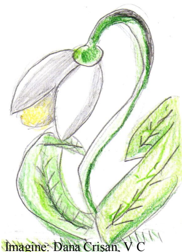
Imagine: Dana Crișan, V C

Într-o zi, înainte de venirea primăverii, florile se înțelegeau care dintre ele să vestească acest eveniment.