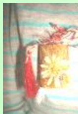
Alice Dumitrescu, clasa a VI-a A

Acum am înțeles mai bine ce vroia să spună profesoara de limba română.