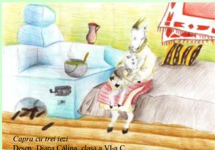
Capra cu trei iezi

Operele sale au dăinuit în timp, amintind poporului român de ingeniozitatea și talentul nemărginit al autorului Creangă, dar și de unicitatea sa, de stilul său caracteristic privit de către cititori asemenea unor raze blânde de Soare într-o zi de primăvara, după îndelungate și întunecoase luni de iarnă.