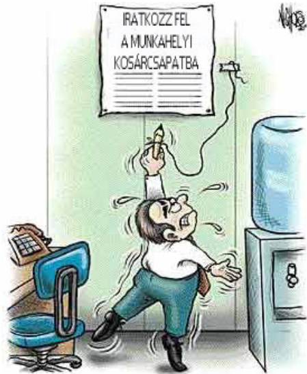
Az élet néha finoman tud értésünkre adni bizonyos dolgokat